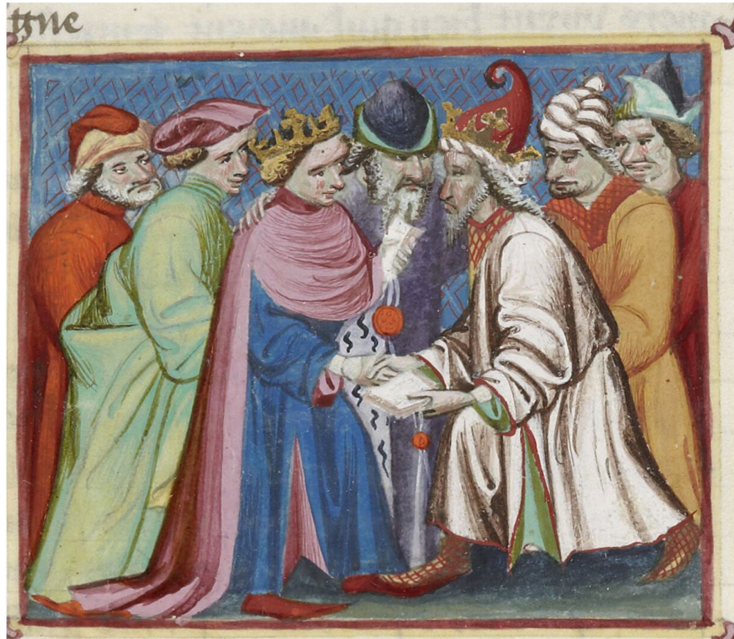
Paix entre Philippe III le Hardi et Mustansir Billâh (BnF, ms. Français 2608, f. 352ra)